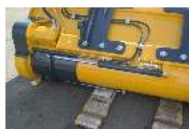
Hydr schuif / trappe de fermeture