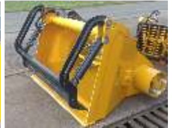
Kuilschraper Racloir à silo