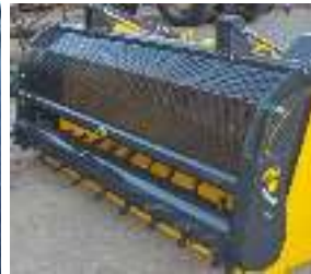
Mobiele frees Fraise mobile