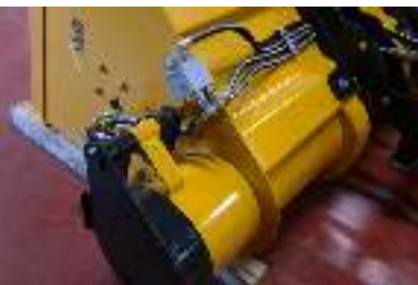
Hydraulisch / hydraulique