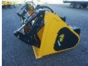
Uitkuilklem 4 cilinders Machoir de désilage 4 cylindres