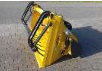
Uitkuilklem 2 cilinders Machoir de désilage 2 cylindres