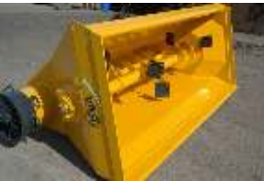
Menger voor korte produkten Mélangeur des produits courts