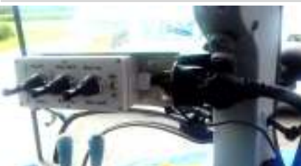
Joystick bediening Commande joystick