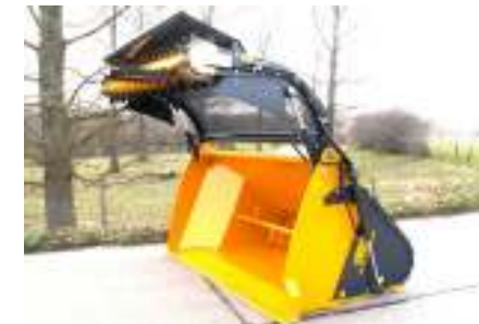
Mobiele frees Fraise mobile