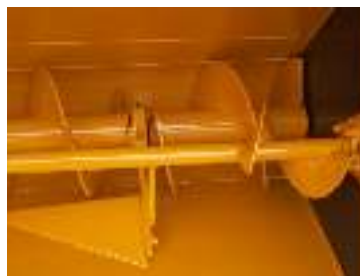
Roervijzel Vise mélangeur