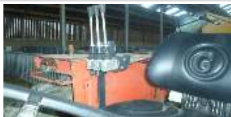
Kabelbediening Commande par cable