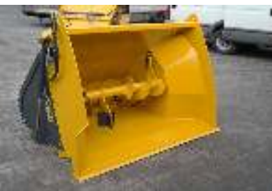
Menger voor korte produkten Mélangeur des produits courts