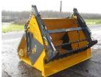
Uitkuilklem 4 cilinders Machoir de désilage 4 cylindres