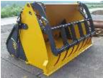
Uitkuilklem 2 cilinders Machoir de désilage 2 cylindres