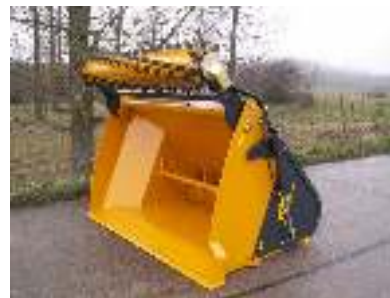
Vaste frees Fraise fixe