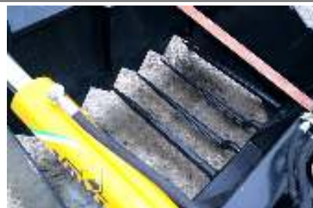
Met tanden in de bodem = type KH-T