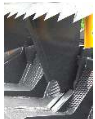
Couteau centrale à partir de 2.30m