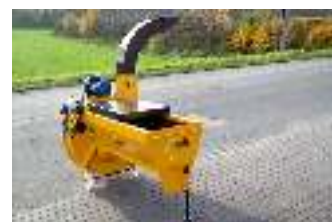
BM-E1= snijden en reinigen couper et nettoyer