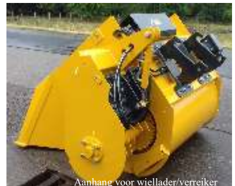
Aanhang voor wiellader/verreiker Attelage pour chargeur sur pneus / télescopique