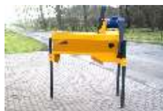
BME-ECO = snijden en reinigen couper et nettoyer