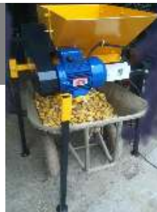
BM ES = snijder couper