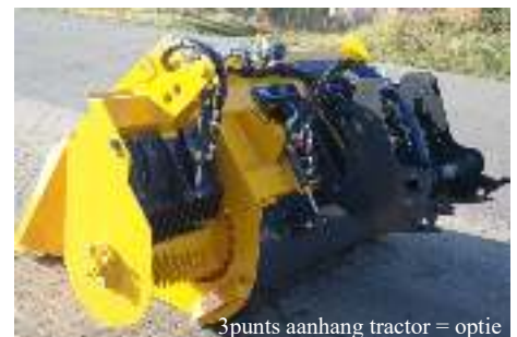
3punts aanhang tractor = optie Attelage 3points pour le tracteur = option