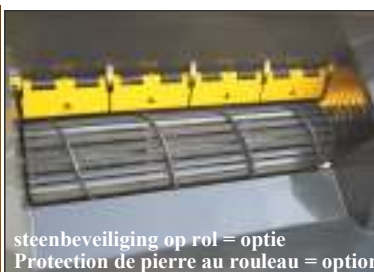
steenbeveiliging op rol = optie Protection de pierre au rouleau = option